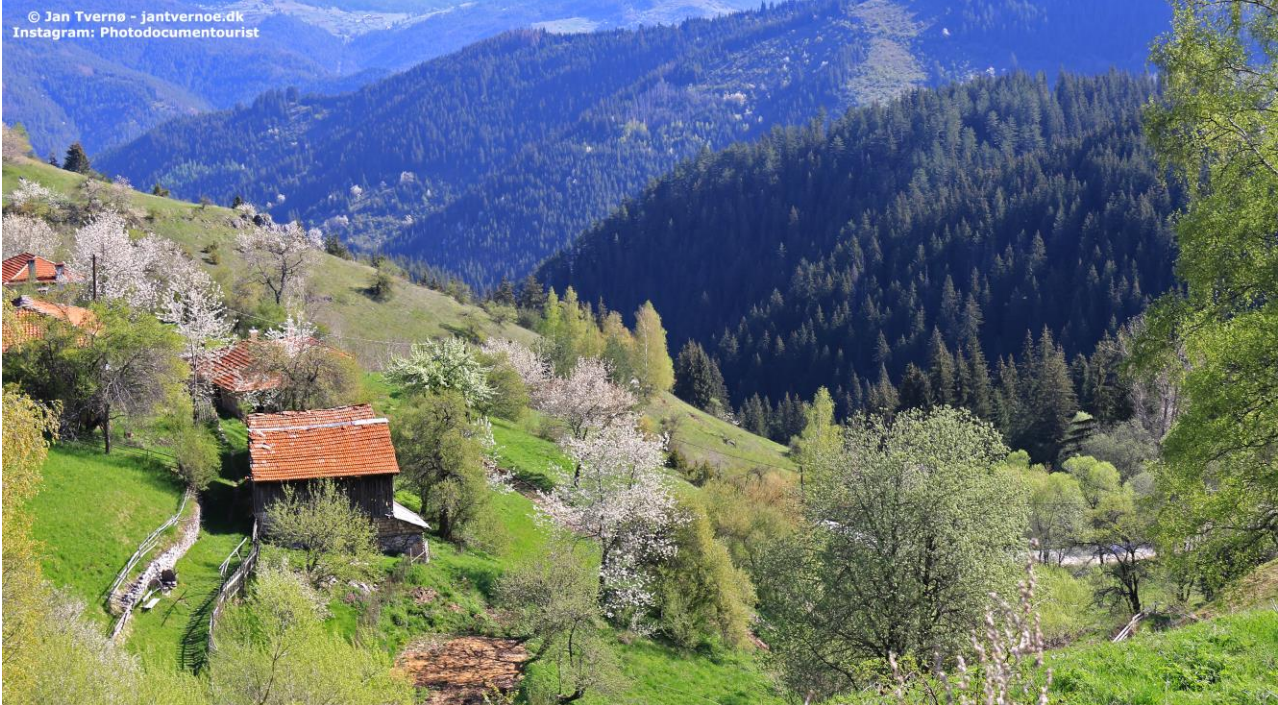
Rhodoperne byder på smukke vandreoplevelser i et overkommeligt terræn. Kendt fra TV2-Programmet "Flokken".

Bulgarien ligger smukt og meget lidt besøgt i Europas oversete hjørne - Det Sydøstlige Balkan og er det helt optimale sted for aktive oplevelser kombineret med sund kost, velvære og afslapning.