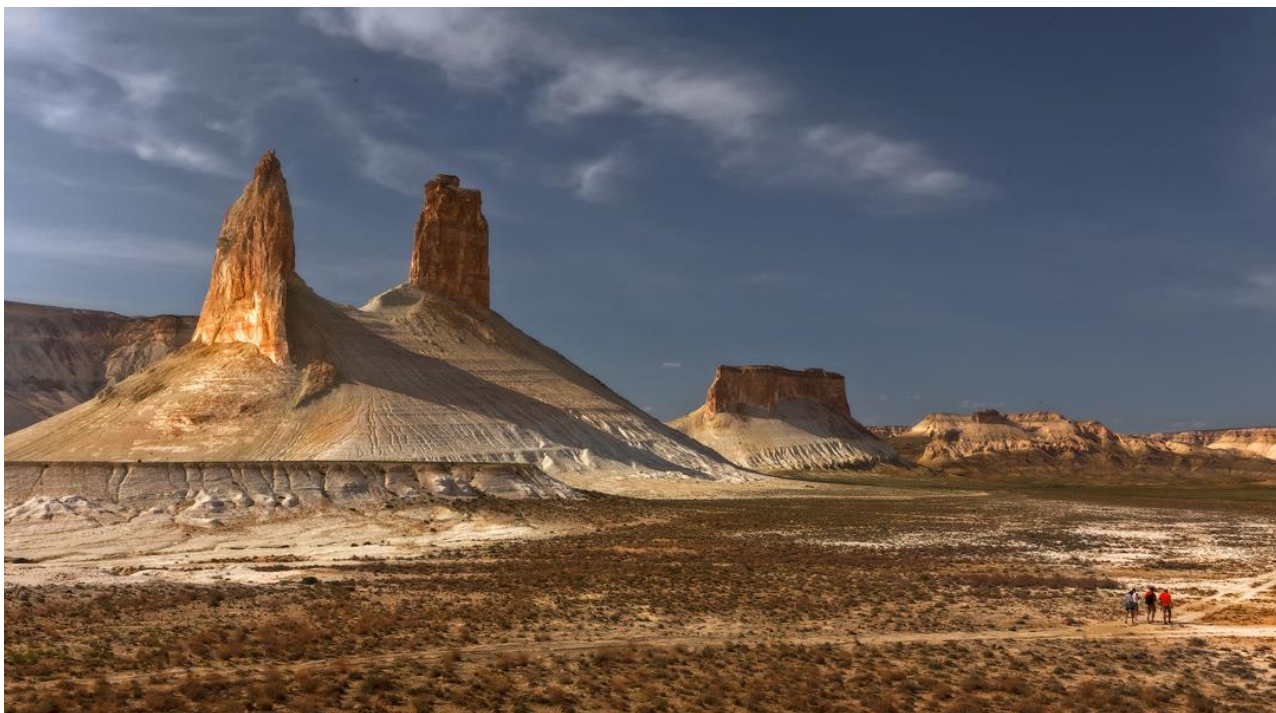
Mangystauplateauet i det vestlige Kasakhstan - 2. etape

4. juni 2020 - 12. juni 2020 (2. etape - Vest)